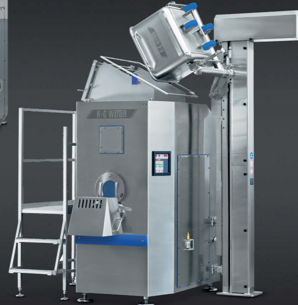
Mixer Automatic Grinder G 160 / U 200