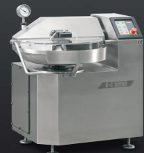
Bowl Cutter 33 L