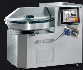
Bowl Cutter twin