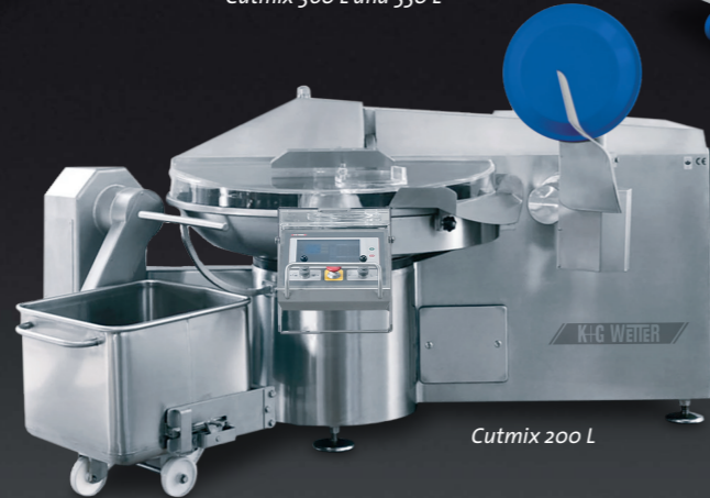
Cutmix 200 L