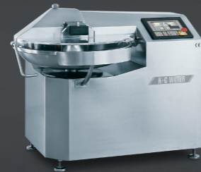
Cutmix 70 L