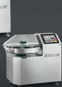
Bowl Cutter 45 L