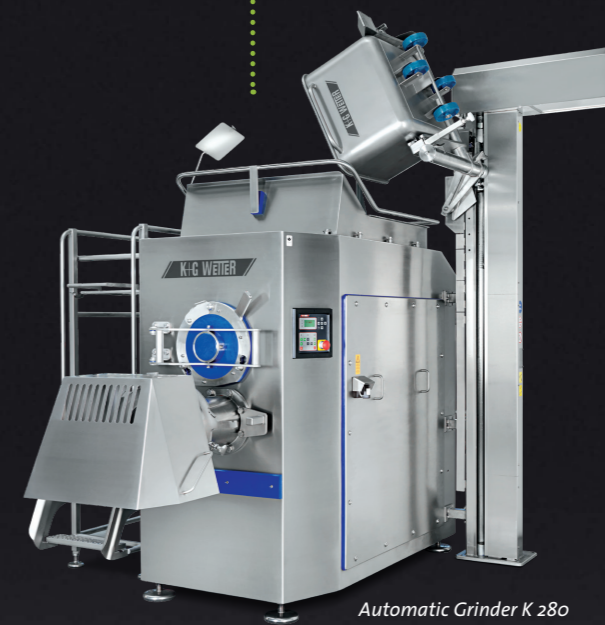
Automatic Grinder K 280