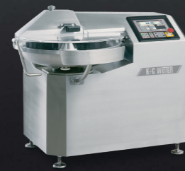
Cutmix 50 L