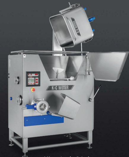
Mixer Angle Grinder E 130 / G 160