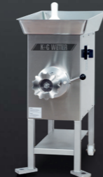
Electric Grinder E 32 / B 98