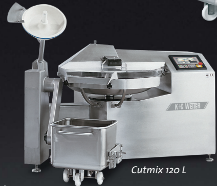
Cutmix 120 L