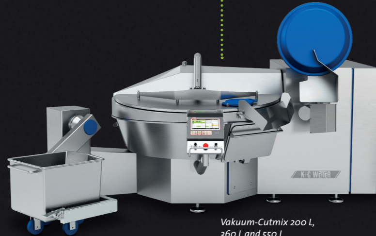
Vakuu-Cutmix 200 L, 360 L and 550 L