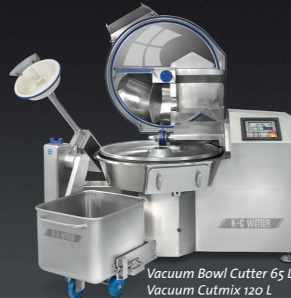
Vacuum Bowl Cutter 65 L / Vacuum Cutmix 120 L