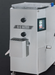
Automatic Grinder / Mixer Automatic Grinder D 114 / E 130