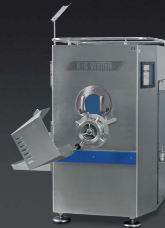
Automatic Grinder G 160 / U 200