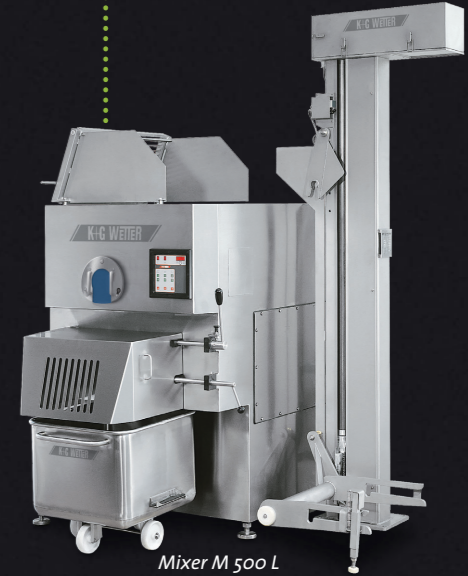
Mixer M 500 L