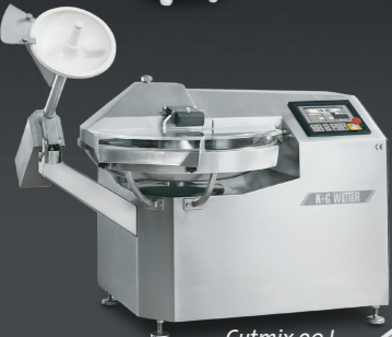
Cutmix 90 L