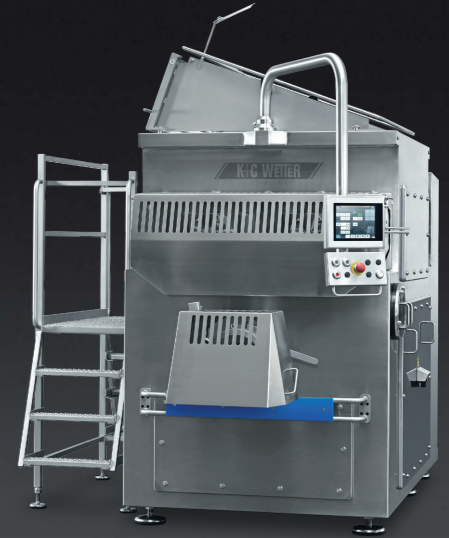
Mixer Grinder U 200