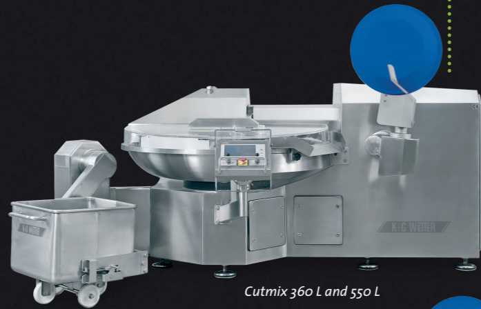
Cutmix 360 L and 550 L