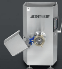
Electric Grinder D 114