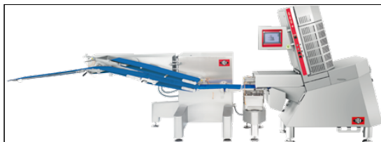
計量・仕分け・包装機までの搬送&自動供給