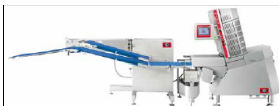
計量・仕分け・包装機までの搬送&手動供給