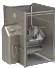
プログラムを実行します