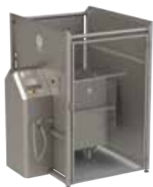
トロリーをマシンに搭載します