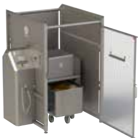
材料をトロリーに投入します