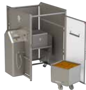
完了後、トロリーを取り出します