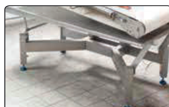
最新のフレーム構造